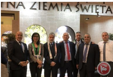
سفیر فلسطين ووفد سياحي فلسطيني في معرض وارسو السياحي

https://universities.ar.studies-in-europe.eu