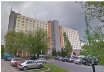
معهد اللغة في مدينة وودج الواجهة الأولى للطلبة الأجانب