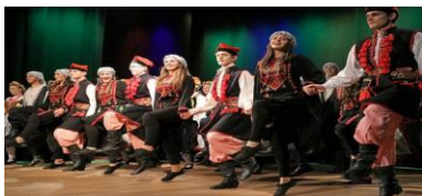
فرقة الزبابده وفرقة بولتكس ودبكه مشتركة في وودج