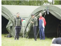
فرقة الهبوط بالمظلات الفلسطينية في بوزنان