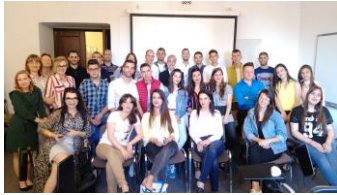
سامريون فلسطينيون في جامعة ارسو