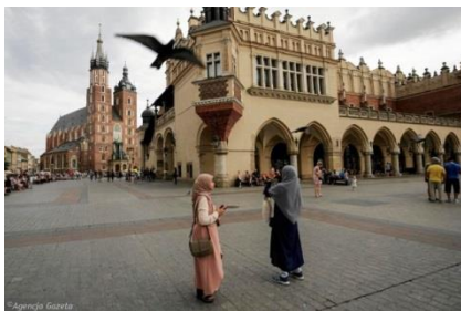
البلدة القديمة وسط كراكوف - السوق "سوكينيتسي"