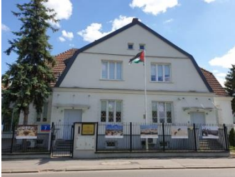
مقر سفارة دولة فلسطين في وارسو