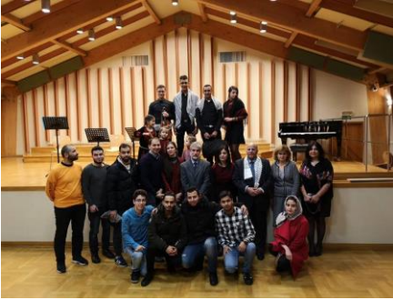
اوتار فلسطينية تلحميه في كراكوف بحضور الجالية الفلسطينية