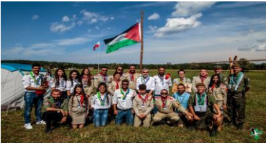
كشافة فلسطينية في مخيم كشمي في غدانسك 2018