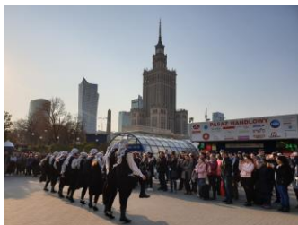
ديكته فلسطينية في ساحة قصر الثقافة وسط العاصمة وارسو