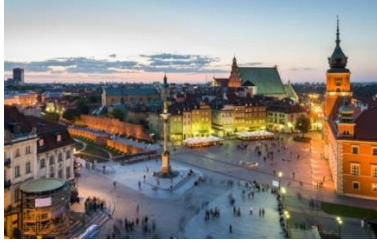
نصب الملك زيغمونت على مدخل المدينة القديمة