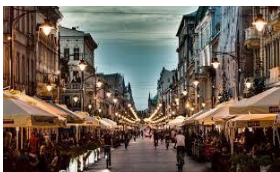
بيوتركوفسكا - الشارع الأشهر في وودج