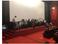
فروتسواف في يوم التضامن مع الشعب الفلسطيني