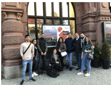
فرقة الزبادة في تورون