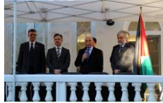
السفراء العرب وأيام فلسطينية