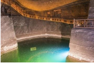
المسار السياحي داخل المنجم

تقع بالقرب من مدينة كراكوف. بني فيها منجم في القرن الثالث عشر بهدف استخراج ملح الطعام، وكان في حينه من السلع الثمينة، وهو من أقدم المناجم الملحية في العالم التي استمر استخراج الملح منها حتى عام 2007.