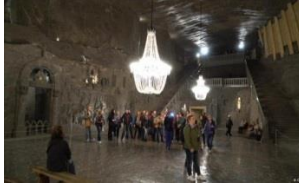
كنيسة من الملح داخل المنجم